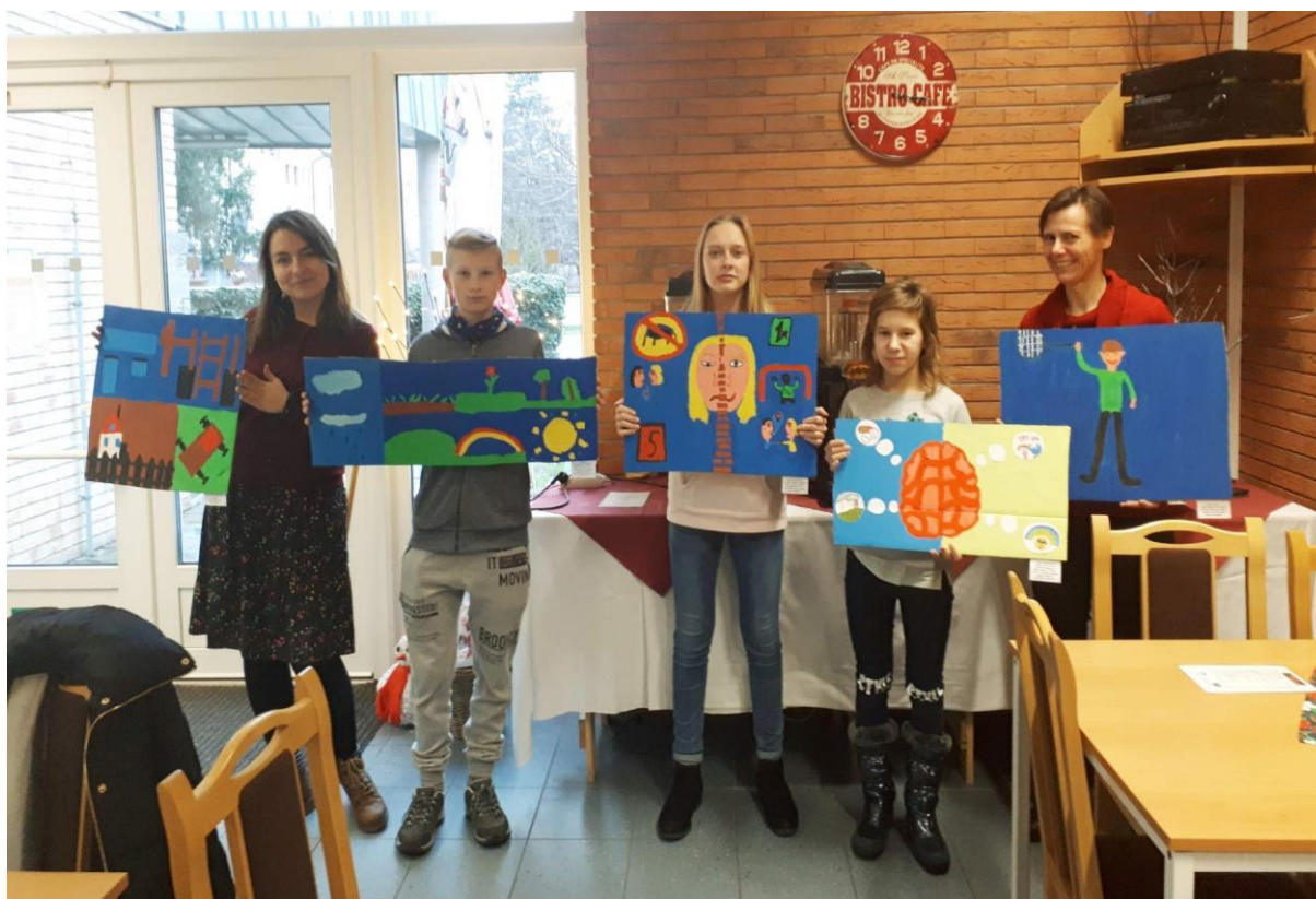
Výstava prací žáků 7.C v centru Kosatec, kterou uspořádala paní školní psycholožka pro zlepšení vztahů mezi žáky ve třídě

Ve škole pracovaly ve školním roce 2018/2019 školní psycholožka, 1 školní asistentka a na 0,3 úvazku asistentka ve školní družině hrazené z OP VV Šablony 1 a 2, které pracovaly se žáky se speciálními vzdělávacími potřebami. Žákům se speciálními vzdělávacími potřebami pomáhalo ve vzdělávání i 6 asistentek pedagoga hrazených z podpůrných opatření. Školní psycholožka připravovala preventivní programy pro všechny ročníky a úzce spolupracovala s třídními učiteli. Osobně se účastnila i mimoškolních akcí – výletů a pobytů v přírodě, aby lépe poznala žáky mimo školu.