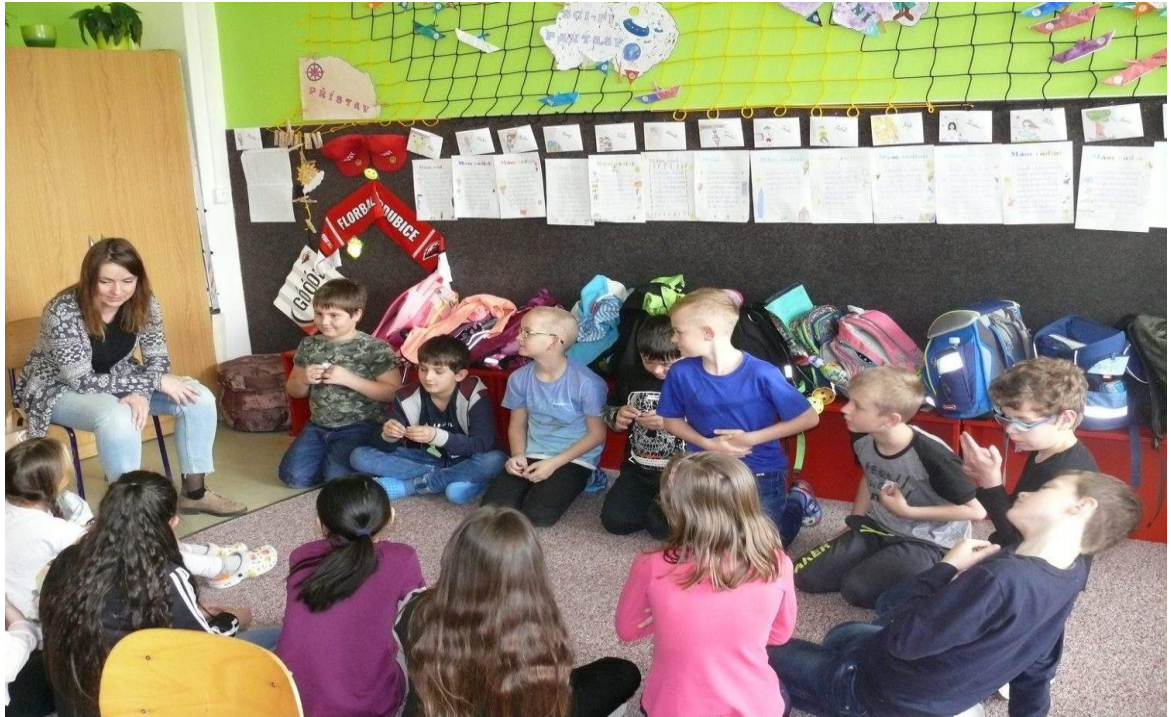
Třídnická hodina ve 3.C

Výchovné i vzdělávací potřeby žáků jsou řešeny na pedagogických radách i při činnosti školního poradenského pracoviště, které je složeno ze školní psychologky, výchovné poradkyně, metodičky prevence a ředitelky školy. Dlouhodobé závažné kázeňské problémy byly řešeny ve třídě 7.C a 8.C. Ve třídě 7.C došlo díky skvělé práci paní třídní učitelky ke zlepšení klimatu a snížení počtu závažných porušování školního řádu.