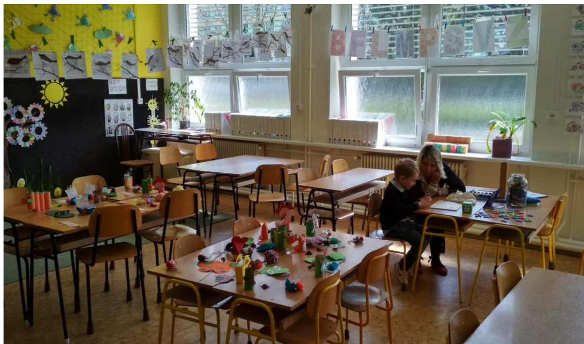
Zápis do 1.tříd