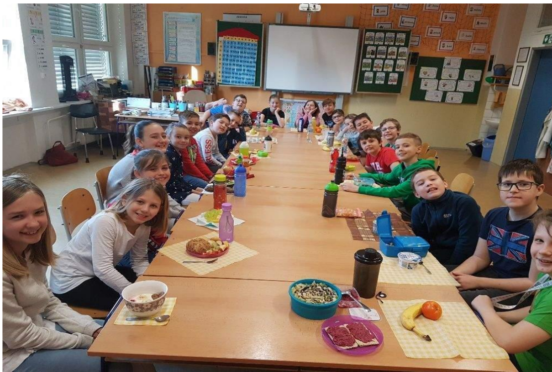
Hrdá škola – Den zdraví