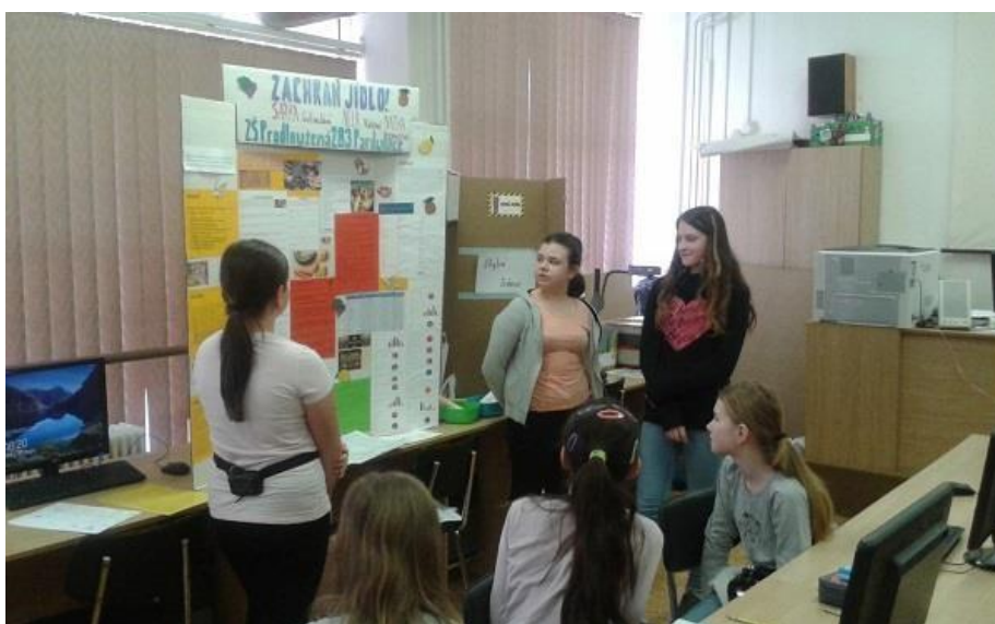
Festival vědy a techniky pro děti a mládež v Pardubickém kraji – projekt Zachraň jídlo oceněný Univerzitou Hradec Králové

Počet pochval výrazně převyšuje počet udělených kázeňských opatření a je dokladem o příznivém klimatu ve škole. Pedagogický sbor podporuje zájem žáků o učení i jejich vztah ke škole oceňováním jejich školní i mimoškolní práce. Pěvecké sbory již 32 let reprezentují školu na veřejnosti a sklízí uznání odborných porot na soutěžích a festivalech, stejně jako uznání a obdiv posluchačů na koncertech. Nadaní žáci reprezentují školu ve sportovních disciplínách i ve vědomostních soutěžích. Podporu jim zajišťují učitelé, kteří je na jednotlivé soutěže připravují. Každý žák má možnost maximálně rozvíjet svůj potenciál a za výsledky své práce je i náležitě oceněn.