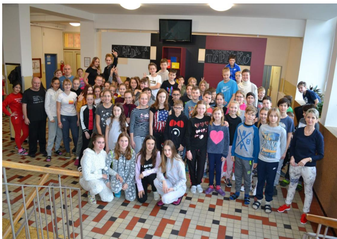
Hrdá škola – Teplákový den

Škola má 5 interních mentorek – ředitelku školy, 4 učitelky na 1. stupni. O kolegiální mentoring nemají pedagogové velký zájem, ale významně se zvýšilo sdílení materiálů k výuce i zkušeností. Některé kolegyně využily v hodinách